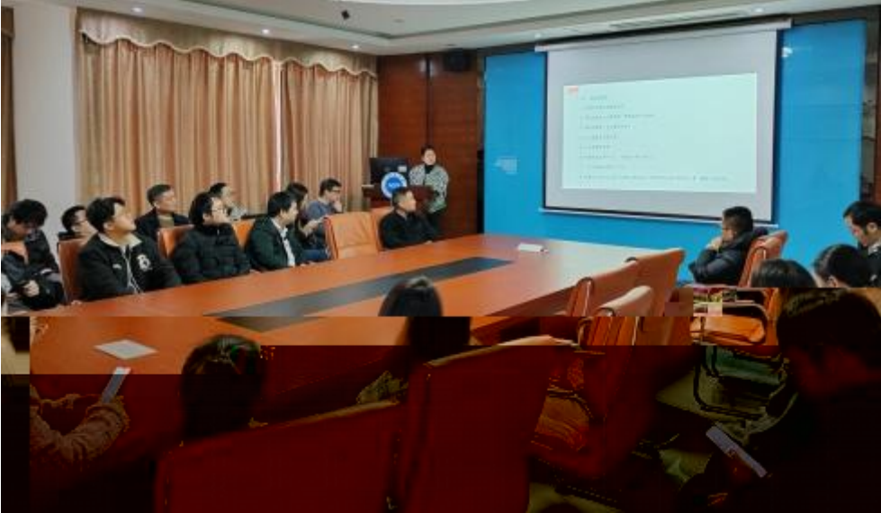
图 员工专业技 培