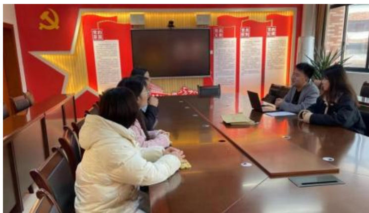
图 企开展学术 交 会