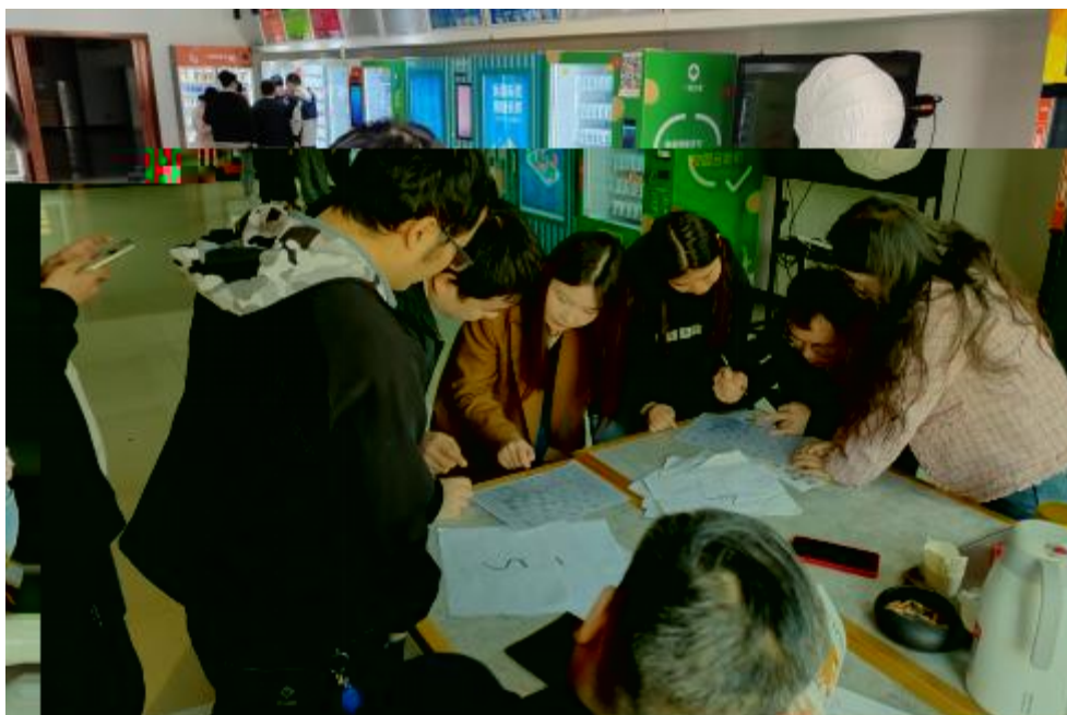
图 卓 团 建 共